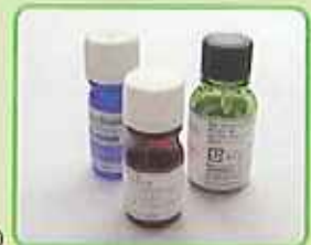
市販のエッセンシャルオイル(精油)

これらを 1、2、3 の順に 100ml のスプレーボトルに入れてよく振り混ぜたら出来上がりです。天然成分で体に害が無いので、就寝前にベッドの周りにシュ！キッチンでもシュ！夏のレジャーに持ち歩いてシュ！、といった具合にお気軽にお使いいただけます。また、蚊を家に寄せ付けない対策として庭にハーブを植えるのも効果的。ローズマリーやバジルは蚊除けに有効かつ、お料理にも使えるので一石二鳥です。アロマで虫除け、ぜひお試しください。